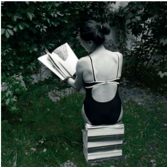
© Marie Denis, 2009 - crédit photographique : Jérôme Chalmette