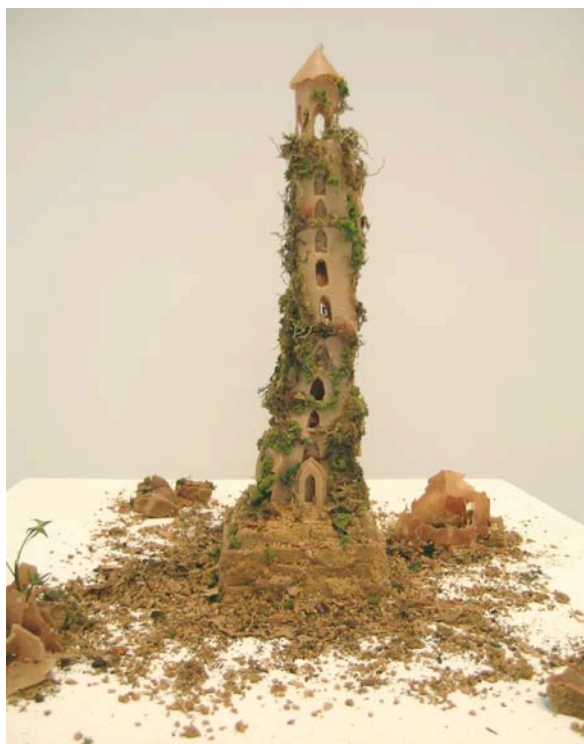
© Gayle Chong Kwan, Terroir , installation, 2009.

Dans les œuvres de l'artiste, comme avec la célèbre « madeleine », notre mémoire resurgit du goût des aliments qui sont utilisés avec la photographie, la vidéo et l'installation comme medium de sa recherche visant à la reconstruction d'une identité culturelle. Dans ses paysages romantiques, le doux se confond avec le dégoûtant et le plaisir avec l'excessif pour représenter la métaphore de la consommation dévoratrice de l'homme, l'altération des villes et de la société causée par le tourisme : Homo Homini Lupus .