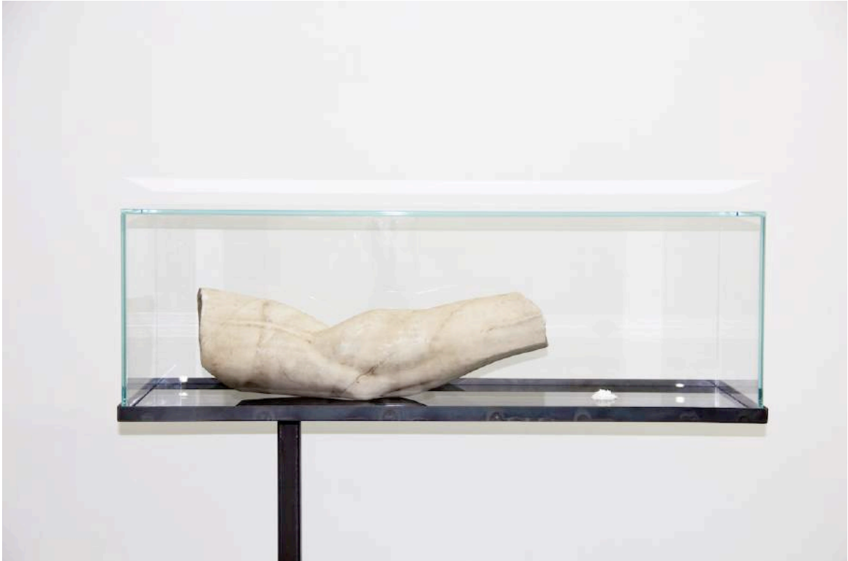
Lithos , 2016

La réflexion de Christian Fogaroli se centre sur l'analyse de l'interaction entre la perte et la récupération et l'impact de ces dernières sur les différents organismes. Comment et selon quelle dynamique les animaux, les plantes et les êtres humains réagissent face à une perte physique ou psychique? Quelles sont les similitudes et les différences? Comment change la perception de chacun devant ces mutations?