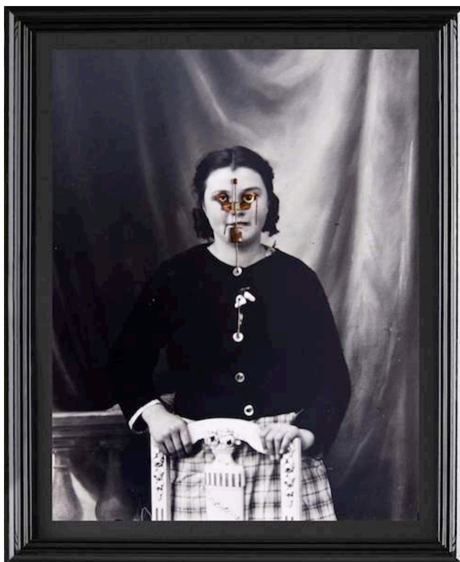
Christian Fogarolli, Left , 2014, objets sur photographie argentique issue d'un négatif sur verre, 57 x 45 cm.