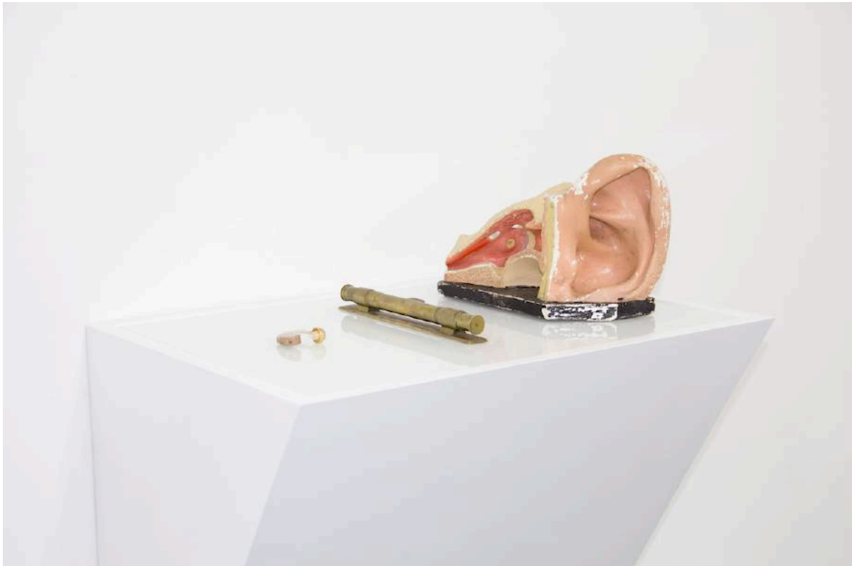
Fantômes de la musique , 2016, installation

GSC : En parcourant ton travail récent et très intense d'artiste, on y retrouve de façon évidente le fil de ta recherche autour de la mémoire, de l'identité, des archives, des traces ; elles resurgissent de tes études d'archéologie, de conservation du patrimoine artistique et de sa gestion, de technologie, de restauration de peintures anciennes et contemporaines.